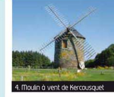
4. Moulin à vent de Kercousquet