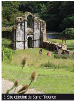
3. Site abbatial de Saint-Maurice