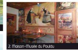
2. Maison-Musée du Pouldu