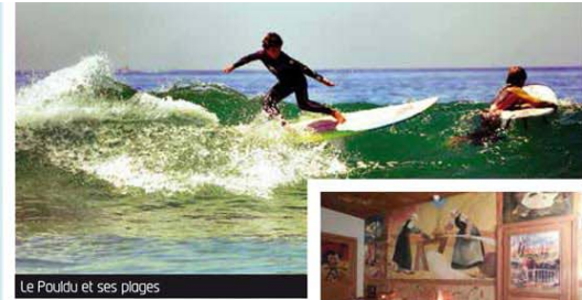
Le Pouldu et ses plages